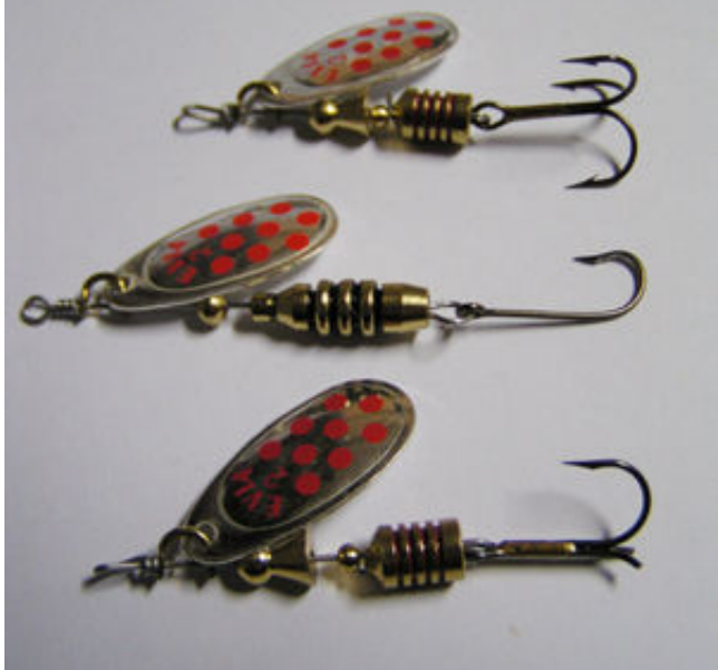
Tipos de cucharillas giratorias (de arriba abajo): tradicional, de un anzuelo sin muerte y tradicional modificada para pescar sin muerte Ramiro Asensio

© Prohibida la reproducción total o parcial sin consentimiento expreso del autor (info@ftpa.es)