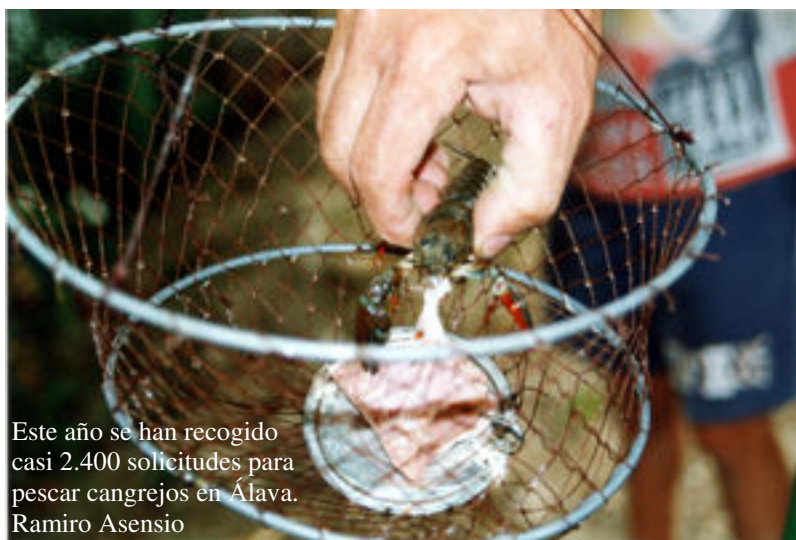
Este año se han recogido casi 2.400 solicitudes para pescar cangrejos en Álava. Ramiro Asensio

Como ya se ha dicho, estos posibles permisos sobrantes estarán a disposición de cualquier pescador que los solicite, haya participado en el sorteo o no.